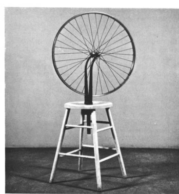
Rueda de bicicleta

En el arte objetual se utilizan objetos de uso común, extraídos de su cotidianidad y que cobran un carácter de objetivo artístico por medio de su modificación, intervención o interacción con otros elementos. El arte objetual se divide en pintura objetual y escultura objetual.